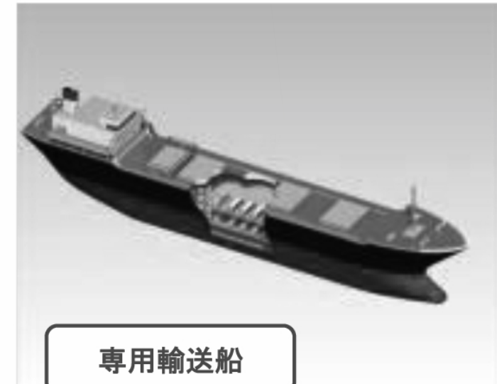
専用輸送船 ↓ 最寄りの港から陸上輸送