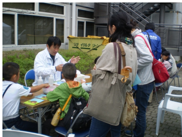
バントナイト実験の様子