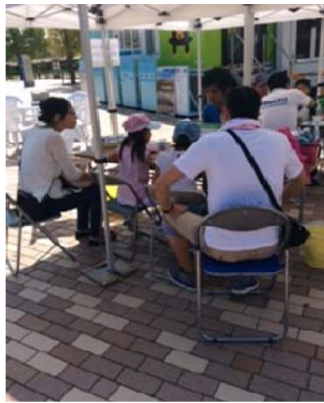
<ベントナイト実験の様子>