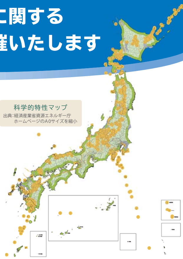
科学的特性マップ

※本説明会は、謝金提供またはそれに類する便益供与等による参加者募集および 一般的な周知を超える参加要請をしない旨を徹底のうえ開催しております。