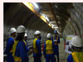
施設見学会の様子

地域の地質環境、地域経済への社会的影響、インフラ整備のイメージをお示ししたり、関連施設の見学にご案内したり、 皆さまの関心やニーズに応じて、柔軟に対応 します。