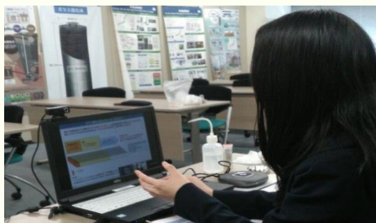
伝わる授業を意識

NUMO職員が教育関係者のみなさまの集まりや学校などを訪問する「出前授業」は実験や映像を交え、楽しみながらエネルギーや地層処分を学習いただけます。事前に不思議な粘土「ベントナイト」を使った実験キットをお送りし、オンラインでも一緒に体験できます。昨年度の出前授業の約6割はオンラインで行いました。