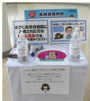
消毒・検温ブース

対面によるイベントを行う場合は、お客さまが安心して楽しく体験できるよう「新型コロナウイルス感染症対策ポリシー」を策定し、消毒・検温の徹底や同時入場者の制限、体験時間の短縮等の対策を徹底したうえで開催しています。