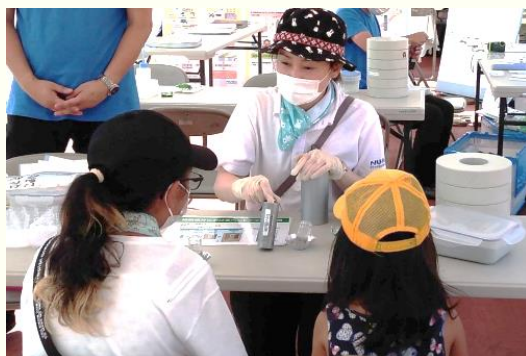
マスク・手袋 着用の徹底