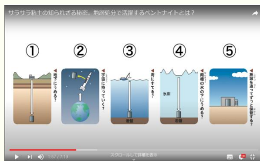
画像を使って分かりやすく