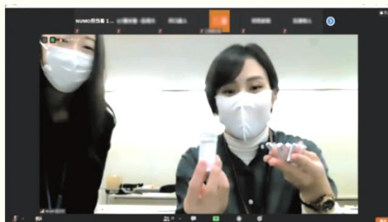
ベントナイト実験は一緒に実演