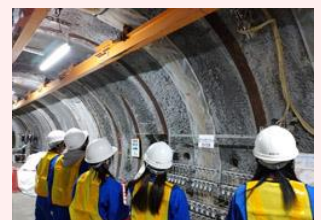
施設見学会の様子