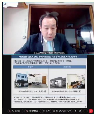
オンラインでのご説明