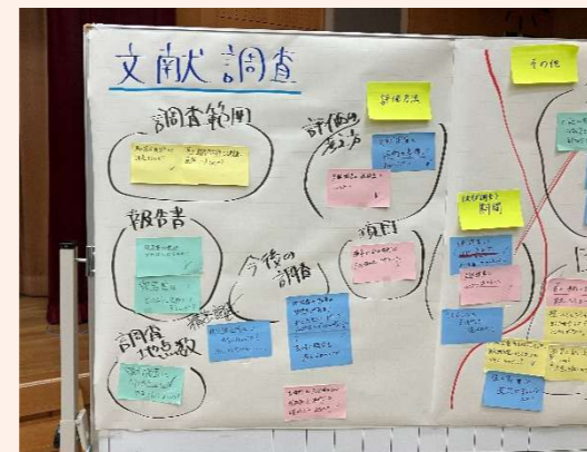
頂いたご意見・ご質問（一部）