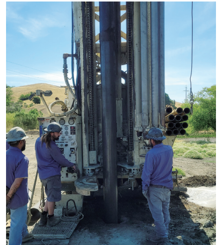
ボーリング孔掘削の作業風景

断層が多く分布するわが国では、地層処分の長期的な安全を確保するうえで断層の性質を詳細に把握することが大変重要です。共同研究に携わる技術部の担当者は「処分場のサイト調査や操業段階などで遭遇する断層は、その活動性を評価することが困難な場合があるため、本共同研究の成果活用が期待できる。今後もLBNLとの共同研究を継続し、この装置の性能確認