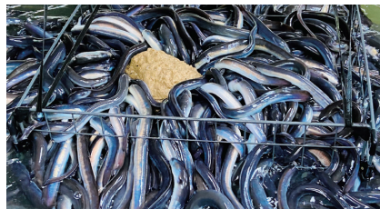
ウナギにエサを与える様子(イメージ)

を始め、年間5千から1万尾の出荷を目指すほか、3年ほどかけて30~50人ほどの雇用創出を図り、将来的には他の魚種の養殖にもチャレンジしたいと同社は話しています。