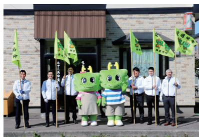
交通安全運動『旗の波』