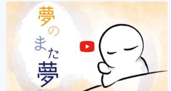
2019年度 動画部門最優秀賞 「夢のまた夢」

デジタルハリウッド主催の映像・webサイト制作コンペ「CREATIVE FOR THE EARTH 2019」において、「高レベル放射性廃棄物の処分問題に対する関心喚起に向けたデジタルコンテンツの制作」をテーマにした作品づくりが行われました。この度、それらの作品の制作レポートをNUMOホームページで公開しました。