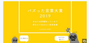
2019年度 web部門最優秀賞 「バズった言葉大賞 2019 「チソる」」