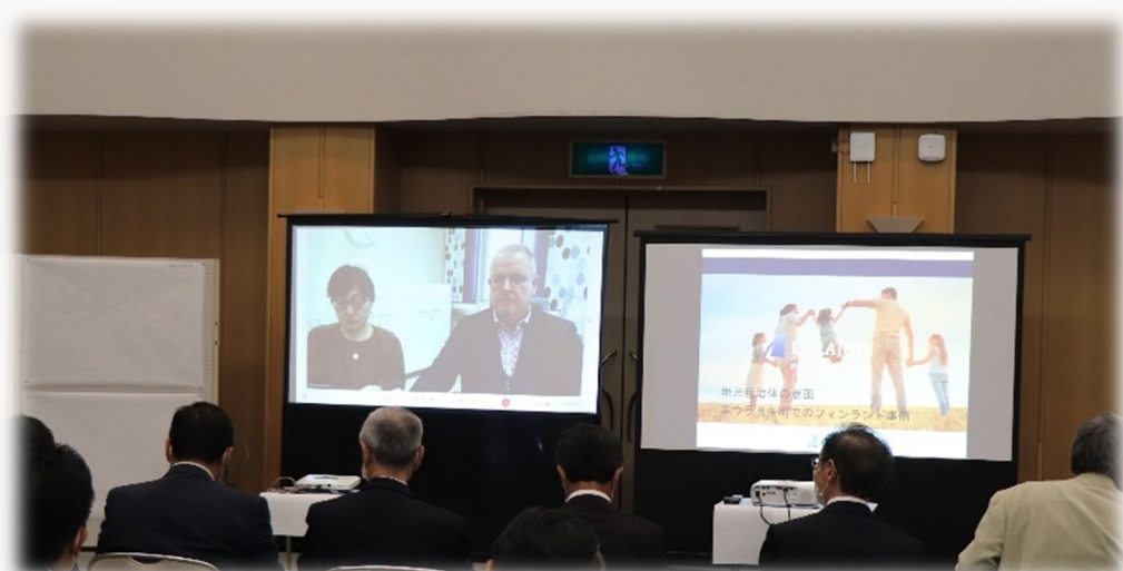
第12回対話の場の様子

⇒具体的な数値はないが、選定される前の状況と変わっていない。町民は、40年以上、原子力と付き合ってきたこともあり、強い感情をもって反対・賛成するといった現況でもなく、地層処分場を受け入れている。