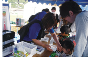
親子でベントナイトを使ったバスボム作り