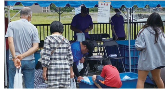
神恵内交流センター職員も祭りの運営をサポート