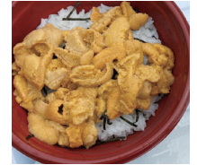
早朝から大行列のウニ丼