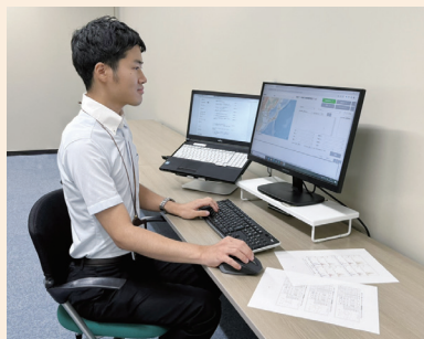
調査で取得したデータを管理するシステムを運用