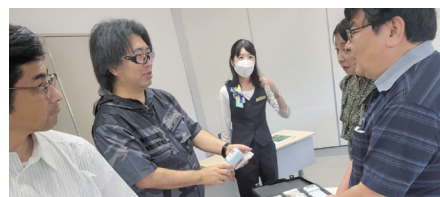
放射線測定の様子

授業に役立てていただくために、六ヶ所原燃PRセンター他（日本原燃株式会社）の見学会を7月26日、27日に開催しました。