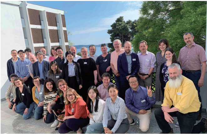
ワークショップの参加メンバー