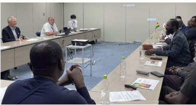
人材育成などをテーマに熱く意見交換