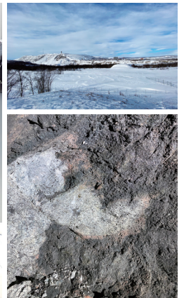
左：北海道大学－NUMO合同研究チームのメンバー／右上：スウェーデンのキルナ鉱山／右下：ベントナイトの採取箇所（白色～灰色部分）