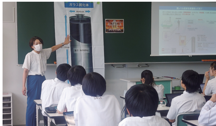
NUMO職員による早稲田佐賀中学校・高等学校での出前授業（2023年7月20日）

小学校から大学の授業を対象に出前授業を実施しています。授業では、水に触れるとその部分だけが膨らんで固まるベントナイトという粘土（人工バリアのひとつ）を使った実験や、ボードゲーム、ディスカッション等の体験型の授業を取り入れることで、子どもたちの主体的な学びにつながればと考えています。