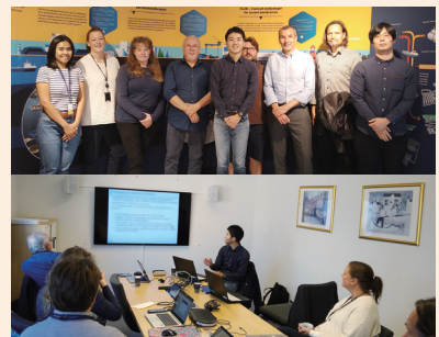
継続的にSKB(スウェーデン核燃料・廃棄物管理会社)と意見交換を実施し、SKBの知見やノウハウを吸収